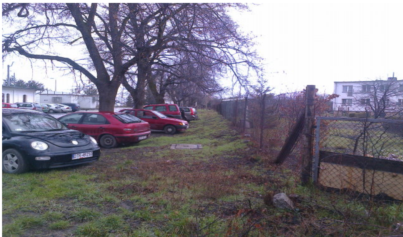
Zdjęcie nr 5 widok parkujących pojazdów obecnie przy wschodniej granicy działki .

Podział stanowisk parkingowych kostką betonową w kolorze kontrastującym z kolorem nawierzchni placu .