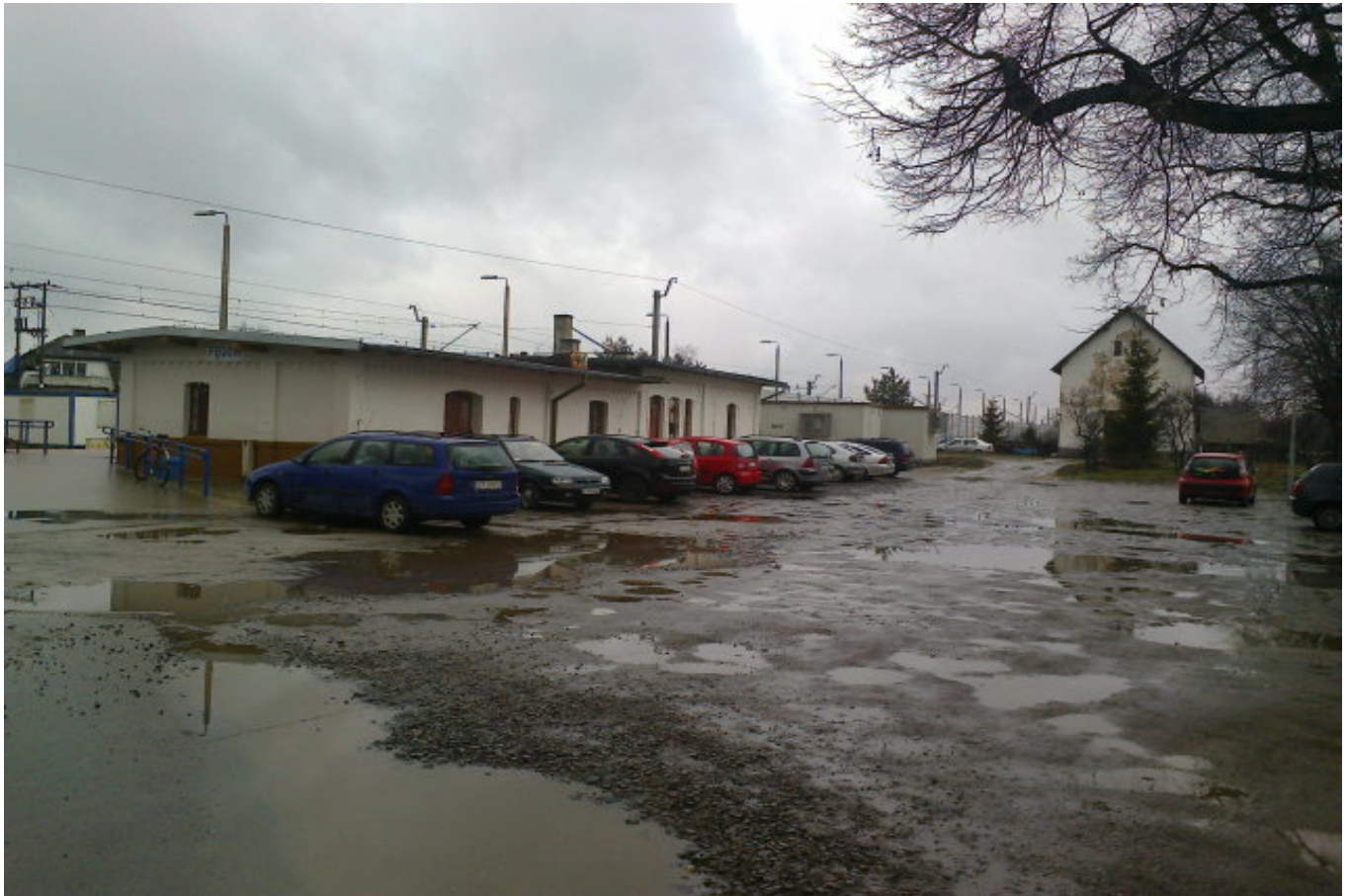
Zdjęcie nr 2 Widok na budynek dworcowy przy stacji kolejowej w m. Pęgów .

Planowany zakres przedmiotowego zadania zalkalizowany jest na części działki nr 28/2 po stronie wschodniej przy budynku stacji w m. Pęgów oraz na części działki nr 379 leżącej po przeciwnej stronie DW 341 .