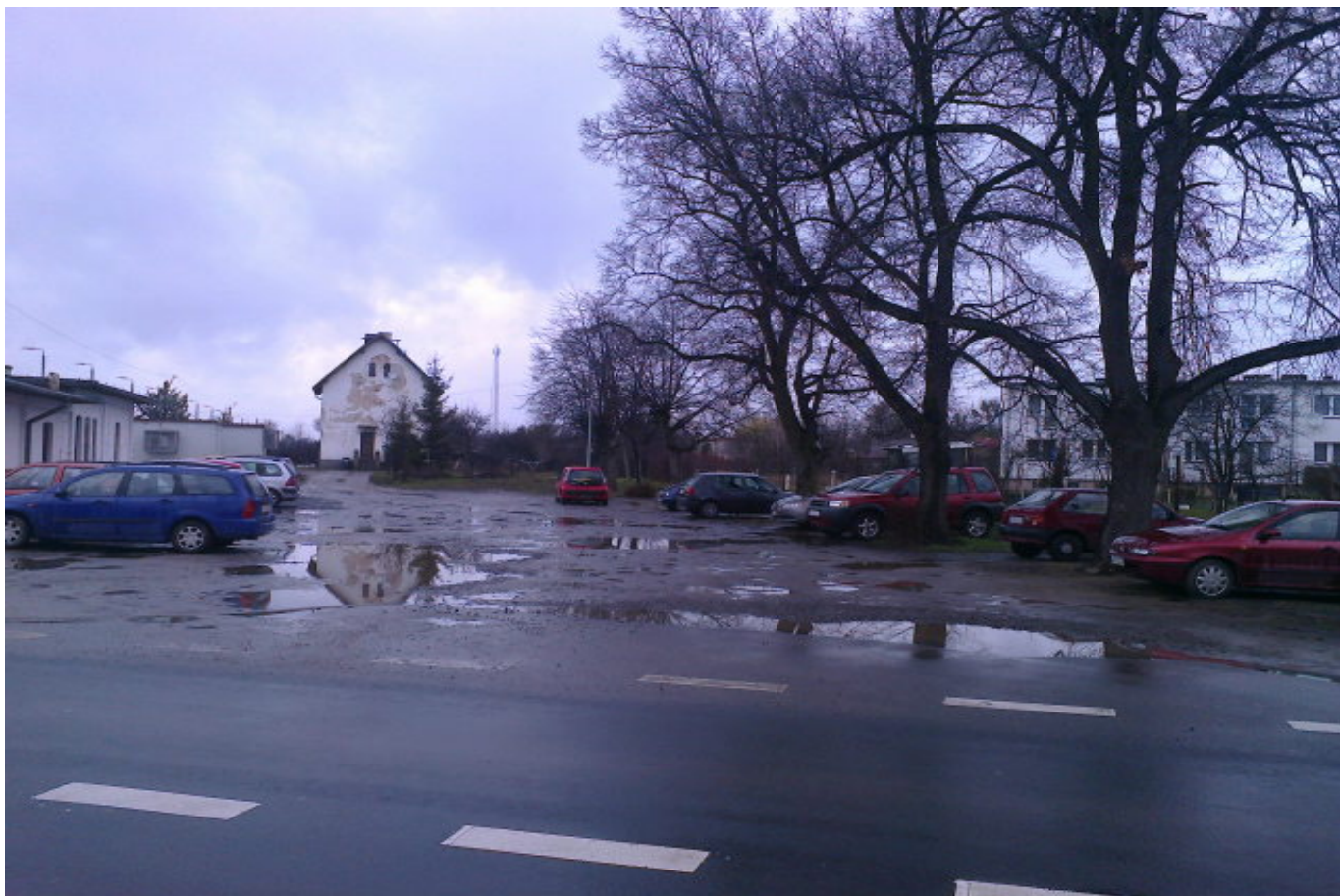
Zdjęcie nr 3 wjazd na działkę nr 28/2 z drogi wojewódzkiej .