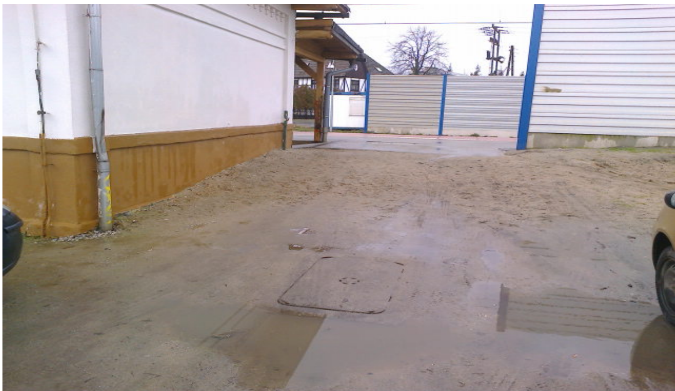
Zdjęcie nr 4 widok wyjście na peron przy budynku stacyjnym .