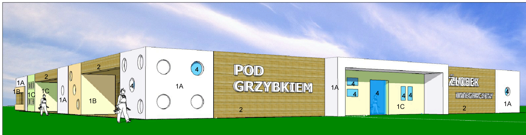
widok strefy wejściowej